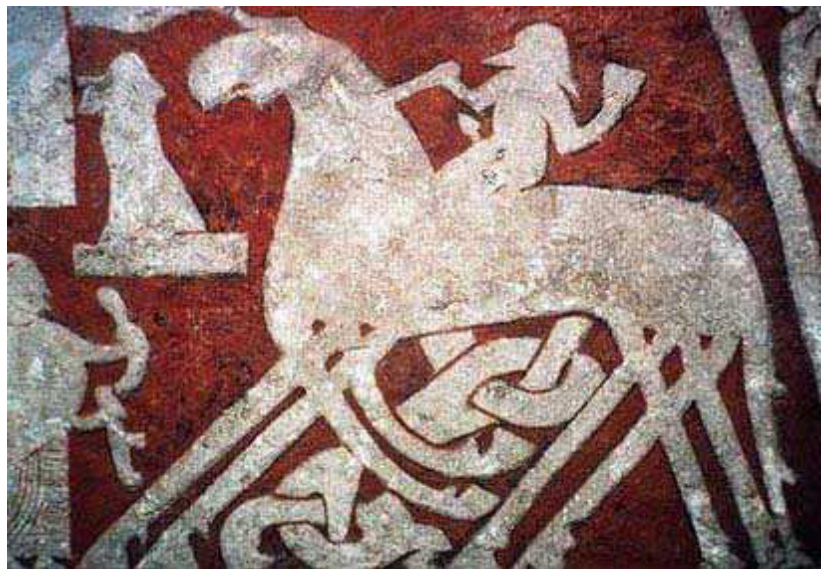
Odin auf seinem Pferd Sleipnir

In den Legenden wurden den Kindern während der zweiten Klasse Menschen vorgestellt, die auf der Erde angekommen sind und bereits eine bio-