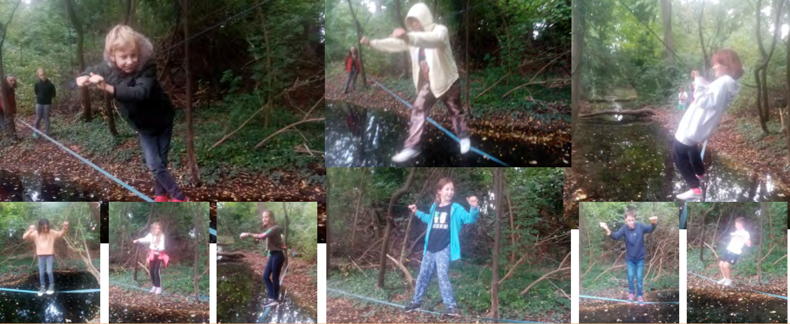
MUT! Das Thema rund um Michaeli. Unsere Schüler bewiesen heuer ihren Mut unter anderem beim Überqueren des Baches auf der Slackline.

Entschluss, es noch ein Mal zu versuchen.