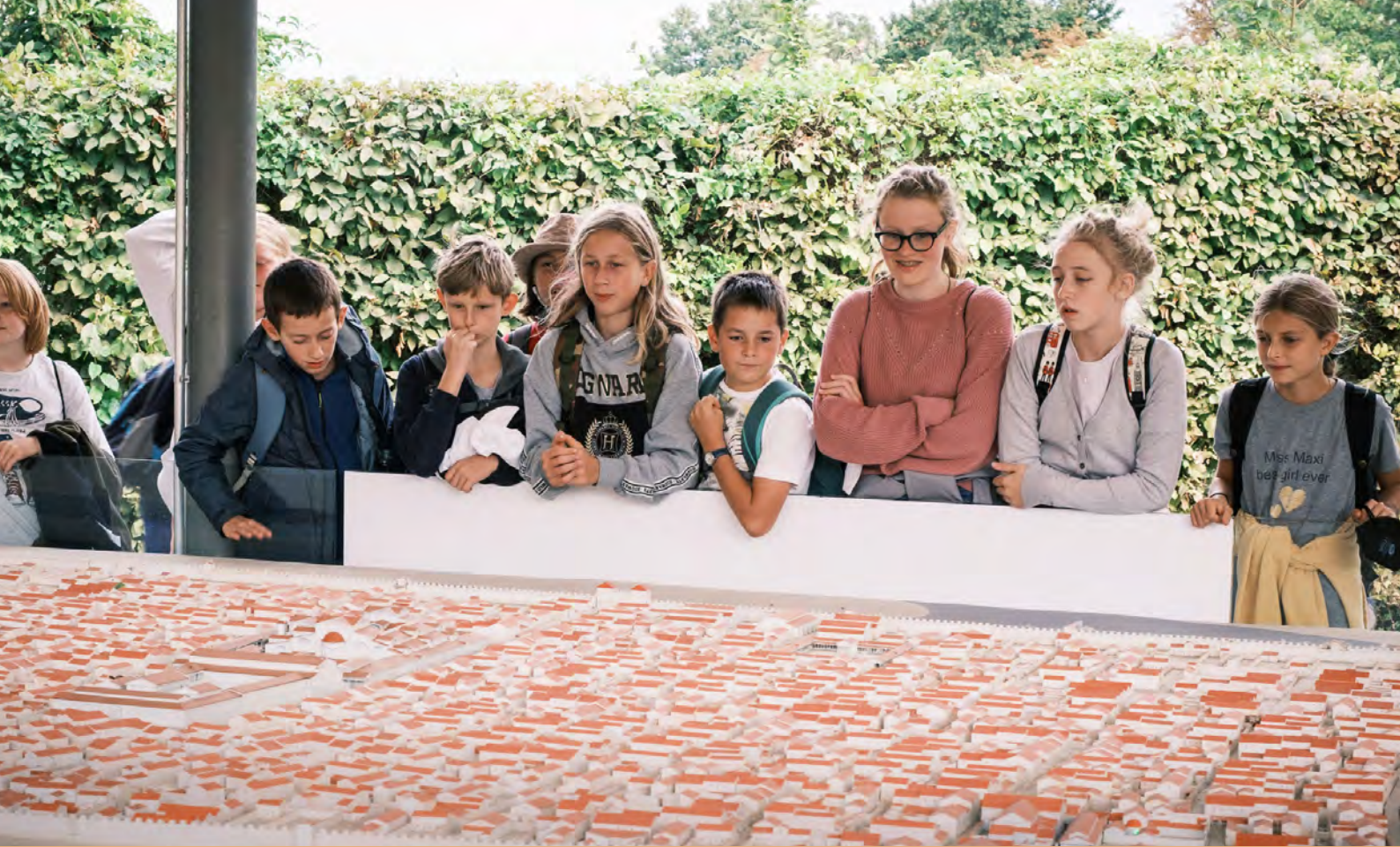
Aufmerksames Lauschen an einem interessanten Tag.