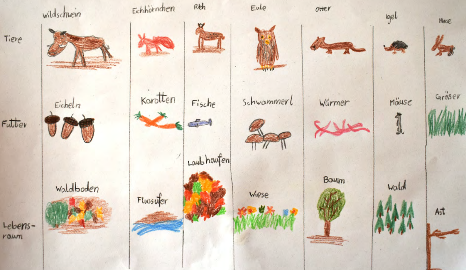
HERBSTRÄTSEL (gestaltet von Vinzenz, 3. Klasse)

Der Herbst ist da! Die Waldtiere bereiten sich schön langsam auf die Kälte vor. Wer frisst was und wo lebt er eigentlich? Viel Spaß! (Die Auflösung findet ihr gleich unterhalb in der Pinnwand!)