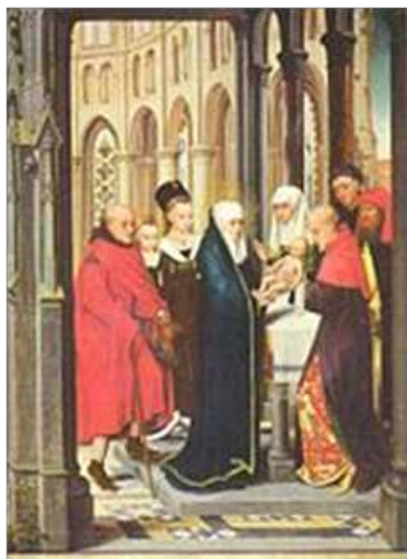
Darstellung Christi im Tempel