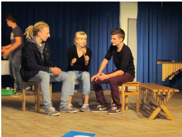
Öffentliche Bühnenpräsentation des Praktikums in Form eines Sketches

Wesentlich war die öffentliche Präsentation der Ergebnisse an der jeweiligen Schule (Oberstufenforum, Elternabende, Schulfeste, Tage der Offenen Tür etc.). Die übergreifenden Evaluierungstreffen fanden im Projektzeitraum 3-mal statt und zwar am 31.01.2014 und am 17/18.10.2014 in Graz und am 12./13.06.2015 in Klagenfurt. Eine öffentliche Präsentation in Graz fand im Rahmen der MitarbeiterInnensitzung des Waldorfbundes Österreich statt und in Klagenfurt bei der Veranstaltung "40 Jahre Waldorfpädagogik in Klagenfurt".