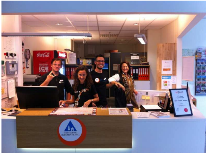
Praktikum in einem Hostel in Oslo

Hoping we can work with some of your students again in the future."