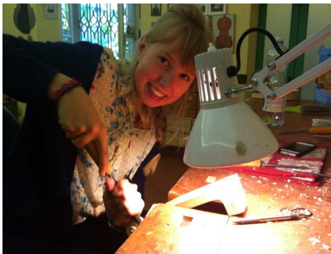
Praktikum in einer Geigenbau Werkstatt in Cremona.

Von den SchülerInnen wurden Praktika in 48 Betrieben in 12 verschiedenen Ländern absolviert. 19 Aufnahmepartner sind sozial-therapeutische Einrichtungen, 10 Betreuungseinrichtungen für Kleinkinder, 9 landwirtschaftliche Betriebe und Pferdehöfe, 10 sind Schulen, 5 arbeiten im Bereich Beherbergung/Gastronomie, 4 sind Kultureinrichtungen und 2 sind Geigenbauer. Weitere Aufnahmepartner waren: 1 Aufnahmestation für Esel, 1 Buchladen, 1 Beleuchtungsfirma, 1 Forschungseinrichtung, 1 Elektriker. Die Entsendeeinrichtung Waldorfschule Klagenfurt führte mit 2 Klassen ein Landwirtschaftspraktikum in Italien beim langjährigen Partner "Fattoria di Varia" durch. Hierbei waren 2 BegleitlehrerInnen aufgrund des jugendlichen Alters von 15 Jahren notwendig. Alle anderen absolvierten ihr Praktikum einzeln oder höchstens zu zweit. Außer den landwirtschaftlichen Praktika der Klagenfurter SchülerInnen dauerten alle Mobilitäten länger als 2 Wochen. Die längste Mobilität dauerte 11 Wochen, die meisten SchülerInnen blieben zwischen 3 und 5 Wochen im Ausland. 26 Betriebe sind ganz neue Aufnahmepartner, die übrigen waren schon in früheren Projekten Partnerbetriebe und tragen zu einer Kontinuität und Nachhaltigkeit bei und zum Aufbau eines europaweiten Netzwerkes von qualitativ hochwertigen, verlässlichen Aufnahmepartnern. 5 entsendende Schulen waren schon in früheren Projekten Partner, als neue Einrichtung ist die Waldorfschule Salzburg ins Netzwerk gekommen.