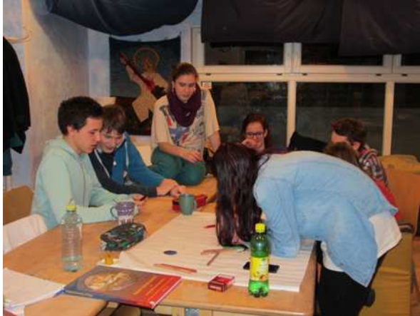
Gruppenarbeit beim Evaluierungsworkshop